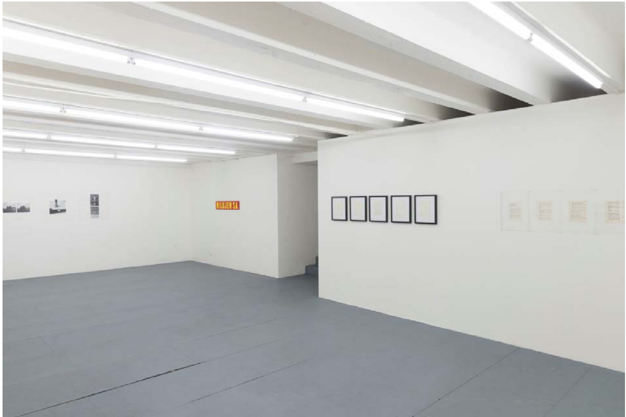
pohľad do inštalácie výstavy / installation view