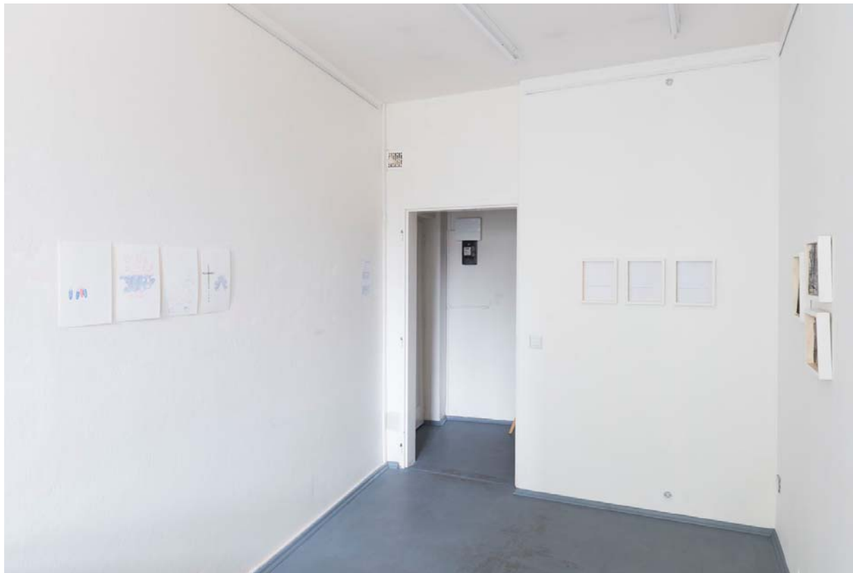
pohľad do inštalácie výstavy / installation view