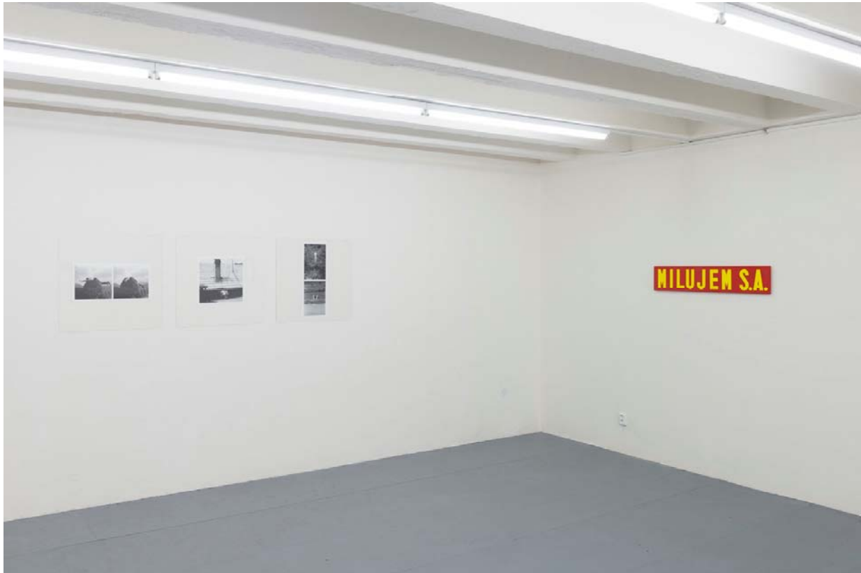
pohľad do inštalácie výstavy / installation view