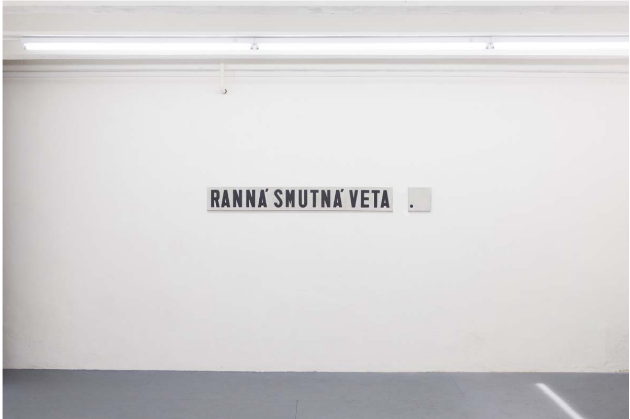
Monogramista T.D. (Dezider Tóth) Ranná smutná veta / Morning sad sentence akryl na plátne / acrylic on canvas, 20 x 160 cm, 20 x 20 cm, 1978