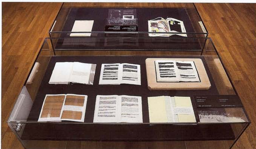
▲ Záber z výstavy DELETE , Slovenská národná galéria, 2012